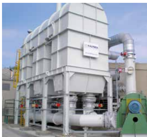
Oxidación térmica recuperativa